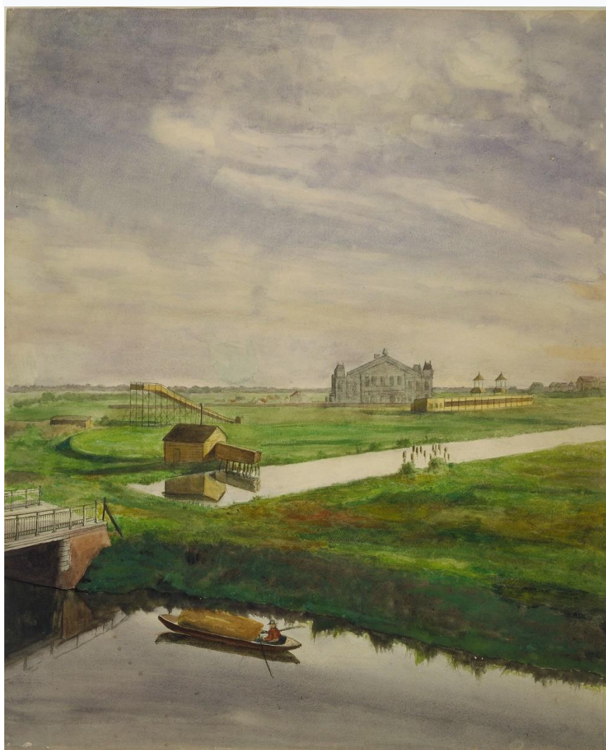
H.W. Beijerinck, Concertgebouw zojuist voltooid, tekening 1887.

Het terrein van het latere Museumplein, gezien vanuit een bovenkamer van het woonhuis Ruysdaelkade 51, over de ijsbaan en de renbaan, naar het zojuist voltooide Concertgebouw. Techniek: potlood, penseel in kleur.